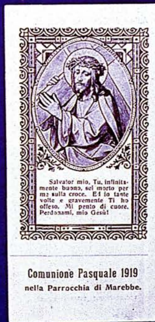
Abb. III: Beichtzettel aus den Jahren 1873, 1911, 1918 und 1919 (Sammlung Prousch-Obermaier).