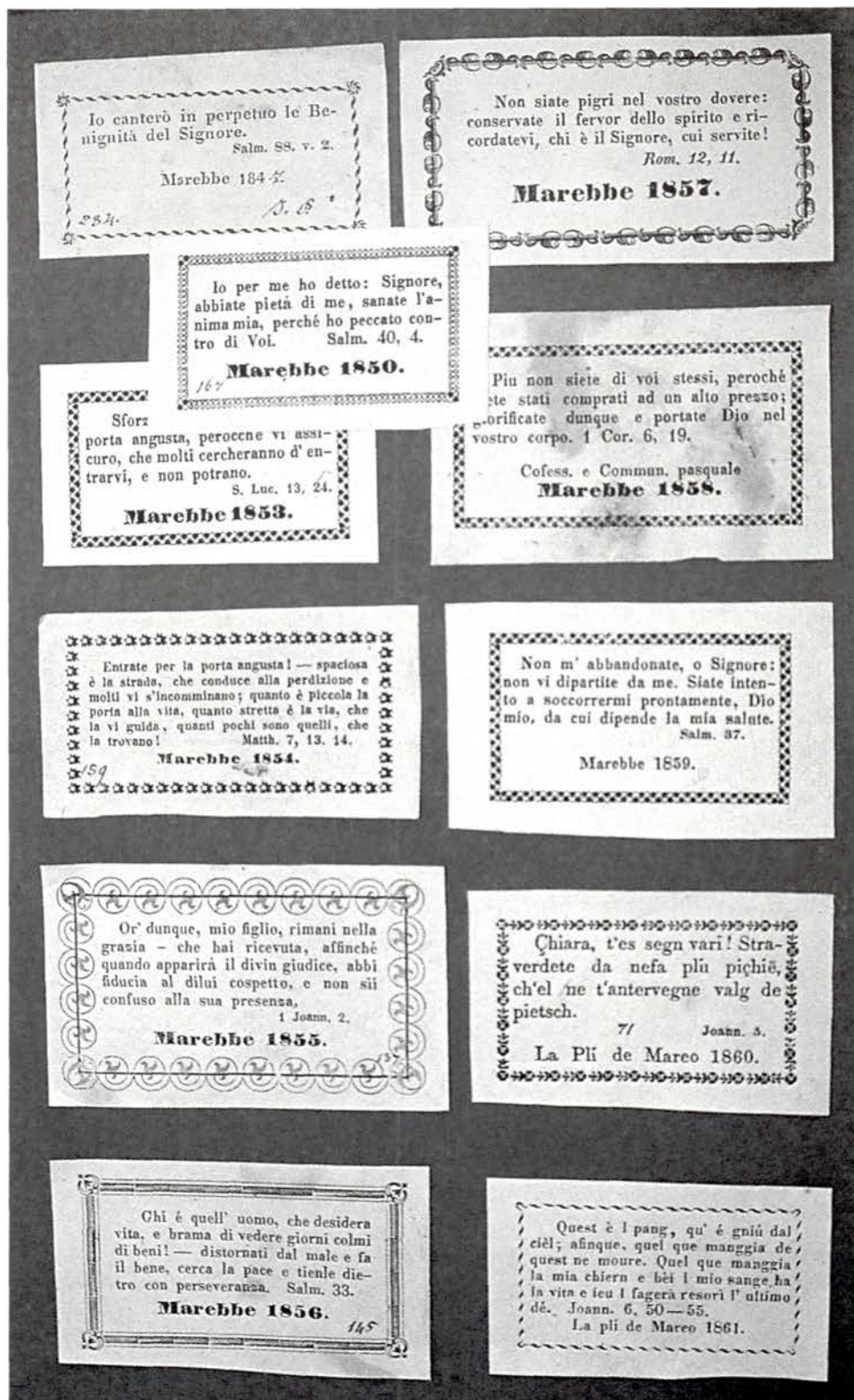
Abb. II: Einige Beichtzettel bis zum Jahre 1861.