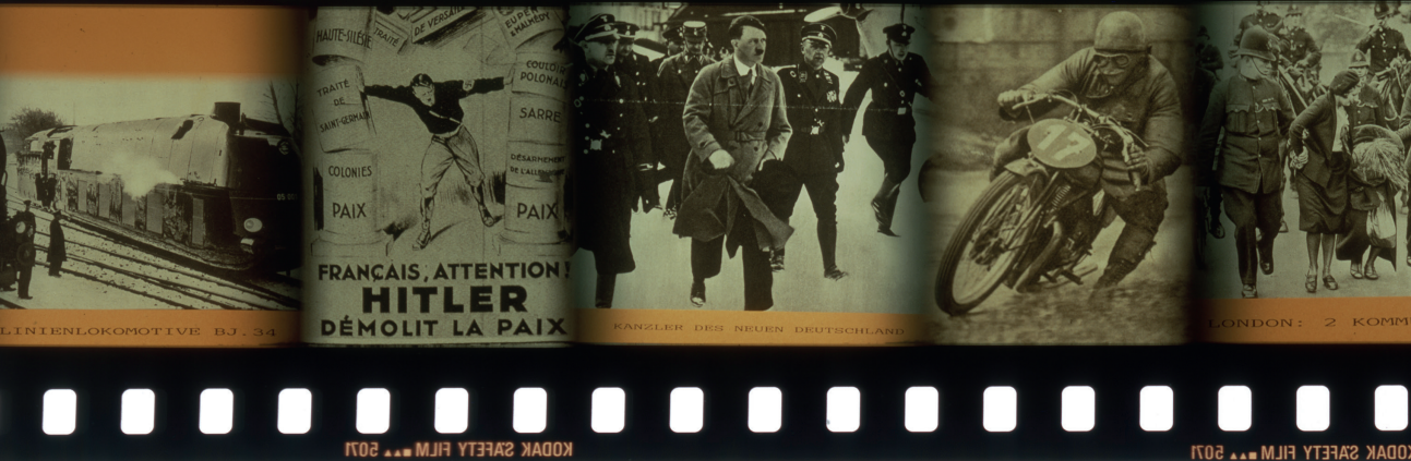
Fig. 5: Details der Optionsausstellung 1989 in Bozen.