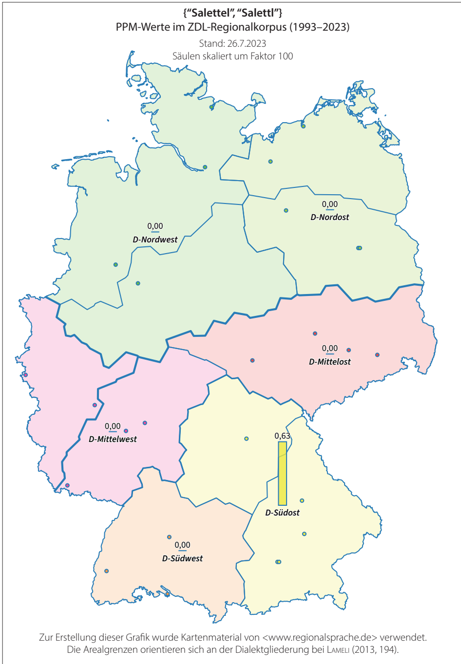
Fig. 3: Regionalsprachliche Arealverteilung Saettel/Saettl in Deutschland (ZFL-Regionalkorpus, < https://www.dwds.de/wb/Saettl >).