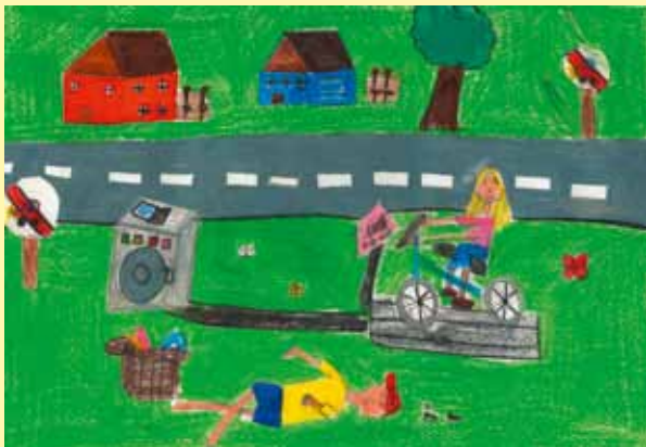
Dessègn dla Scora elementara Corvara